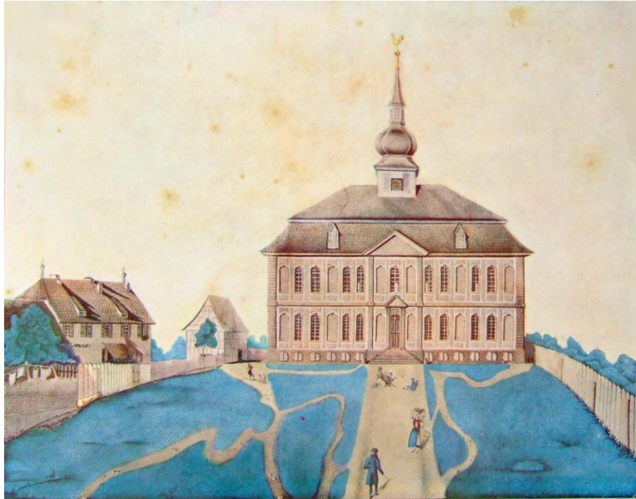
La cour du château de Brumath vers 1818 (dessin de Jean Nicolas) après transformation en lieu de culte.