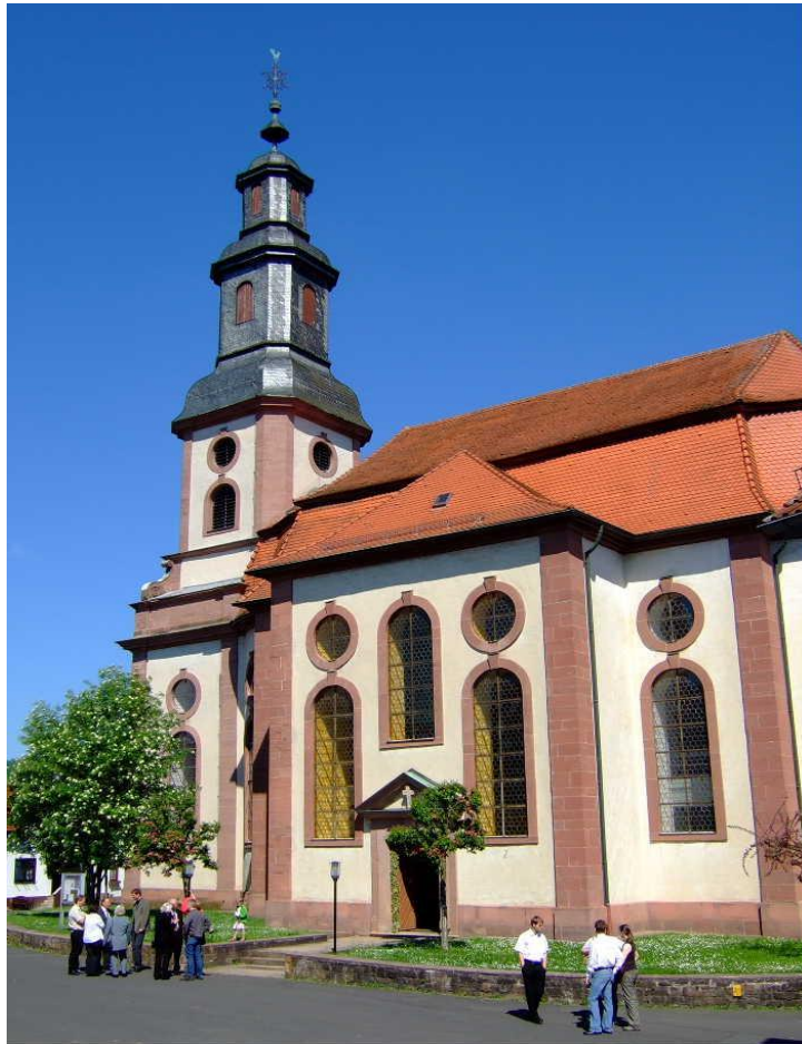
L'église de Steinau an der Strasse (Hesse), oeuvre de Christian Ludwig Hermann (1724-31).