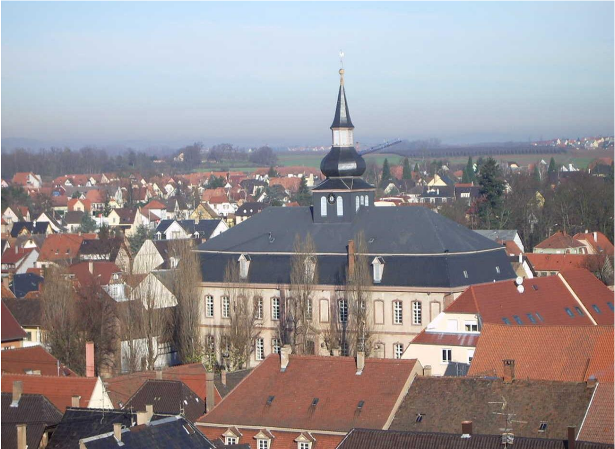
Vue d'ensemble du site de la Cour du Château de Brumath.