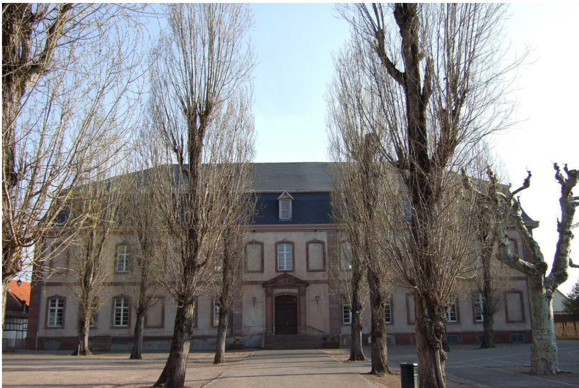
Un aspect de la façade de Hermann du château de Brumath depuis la cour sans le clocher de 1804.